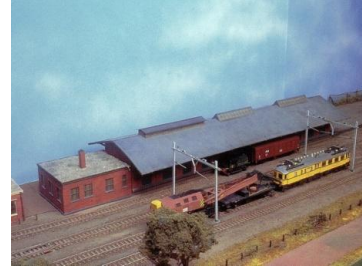
Loods van Gendt en Loos

Het begon allemaal heel simpel. We hadden op de FLEXbaan al een station staan, dat in de verte wel wat leek op het station van Helmond. In eerste instantie zouden we dat uitbouwen. Maar al snel kwamen we tot de conclusie dat we het hele emplacement wilden namaken, vanaf de brug over het kanaal tot aan de plek waar nu de tunnel ligt bij de Burgemeester van Houtlaan.