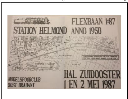
Affiche voor de eerste tentoonstelling van het station

Het gehele project was begroot op 5000 gulden aan materiaalkosten, een kleine 2400 euro. Er moest dus scherp worden ingekocht, want veel financiële steun kwam er niet. Dat had helaas tot gevolg dat de onderbouw van dit deel van de FLEXbaan van mindere kwaliteit was. Het station Helmond heeft het een aantal jaren uitgehouden, maar de werking van het plaatmateriaal zorgde ervoor dat de baan steeds meer gebreken ging vertonen. In 1996 was het gedaan met ons station Helmond.