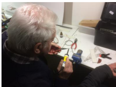
Bomen bouwen voor Station Deurne

Verder is er opnieuw gewerkt aan de wisselaandrijvingen.