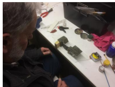
Sluisje voor de TURFbaan

De Turfbaan heeft inmiddels nieuwe LED strip verlichting gekregen. De LED spots die we hadden voldeden niet. Deze verlichting is dimbaar en geeft egalere licht. We leggen nu ook de laatste hand aan de scenery. De waterpartijen worden verder afgewerkt en de lopende banden bij de fabriek gaan ook echt lopen.