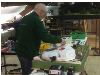
Vivaldi in aanbouw