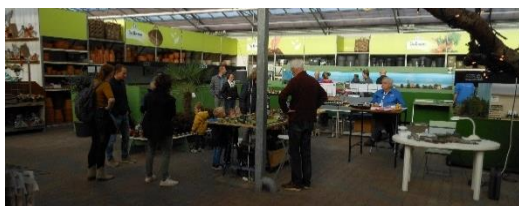
Doorlopende en mooi gedoseerde belangstelling