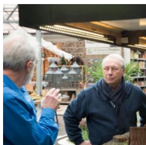
Uitleg over de Turf industrie