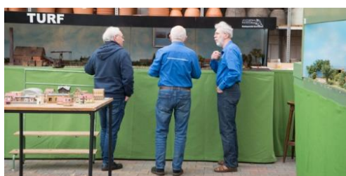
Het kleine TURF overleg