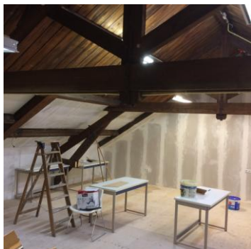
De wanden zijn inmiddels al afgewerkt en de vloer is gereed.

Als lid van de Nederlandse Modelspoor Federatie neemt onze club uiteraard deel aan de jaarlijkse open dagen van de NMF. Ons clublokaal is op 26 maart geopend, van 11:00 tot 17:00 uur. De toegang is gratis. U kunt komen kijken hoe ons clublokaal er nu uit ziet, na de verbouwing. Ook kunt u zelf zien hoever het staat met onze banen in aanbouw. Nu we meer ruimte hebben, kunnen we ook meer laten zien.